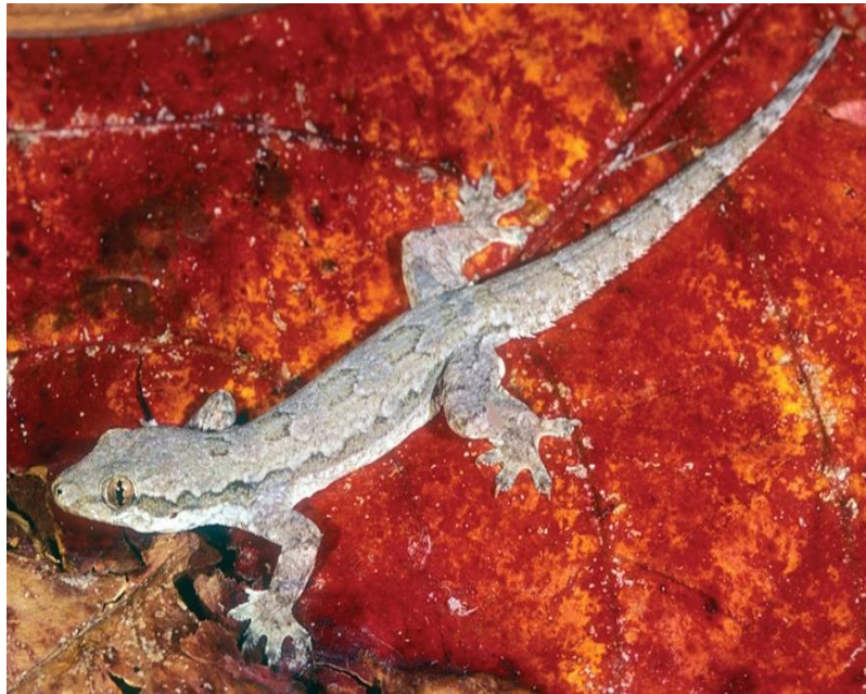
Hình 2.1: Thằn lằn Hemidactylus platyrus (Kaiser et al. , 2011)

(Tên hình đặt bên dưới và được đánh số theo chương)